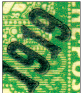
Padělek podtypu Ila na vzácné hodnotě 12 h Koruna a na běžné hodnotě 5 h Koruna. V zájmu vyššího kontrastu přetisku je barva známek potlačena.