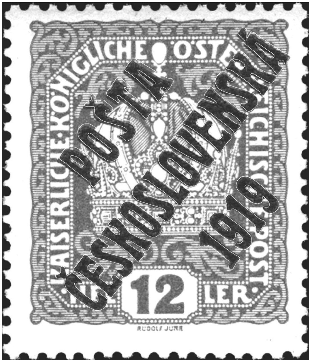
Dole: obrys pravého podtypu a známka s padělaným podtypem; nahoře: prolnutý obrys do falešného přetisku.

2) Srovnávací materiál je přitom poměrně dostupný, a to i finančně – stačí pásky či bloky z pravého okraje tiskových desek 1a, 1b a 2 (zahrnující všechna známková pole s podtypy), a to na nejlevnějších hodnotách 15 h (TD 1a, 1b) a 5 h (TD 2), v celkové katalogové ceně cca 2.000 Kč (což není málo, ale ve specializované sbírce je řada těchto polí obvykle obsažena tak jako tak). Vzhledem ke světlým barvám se tyto nejlevnější hodnoty navíc velmi hodí ke zkoumání při němž rychle zjistíte, že skutečně pravé přetisky s podtypy obsahují řadu různě výrazných charakteristických deskových vad, které se na padělcích nevyskytují (krátce řečeno: padělky jsou v tomto případě příliš dokonalé...).